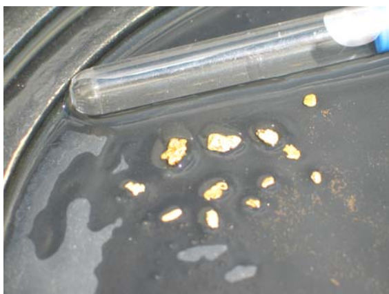
Obrázok č. 1 Vyryžované zlatinky, či skôr nugety zo súťaže „Pusterwald Special“

ľubovoľnej a druhej kovovej plochej, tzv. kanadskej, ktorú dodali organizátori. Súťažiaci dostali tiež dve vedrá súťažného piesku a každý musel prerýžovať na inej panvici. Meral sa celkový čas. Tieto pravidlá boli uverejnené organizátormi vopred na pozvánkach. Už tradičnou tunajšou súťažou je tzv. „Pusterwald Special“, kde každý súťažiaci dostane v piesku 1 g zlatiniek a nugetov. Keďže naviac netradične počas celých majstrovstiev svietilo slniečko bola tu výborná pohodová nálada. Dokonca v sobotný podvečer sme skúsili šťastie na tunajších prírodných claimoch, ale prírodné zlato sme nevyryžovali žiadne. Zato pekných granátov až 1 cm veľkých sme vyryžovali plno. Do nedeľného